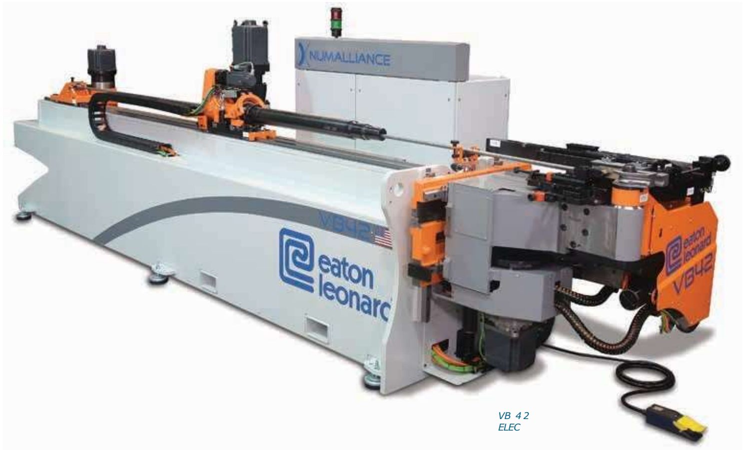
VB 42 ELEC