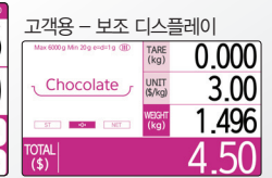
고객용 - 보조 디스플레이