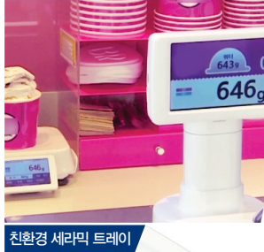
친환경 세라믹 트레이