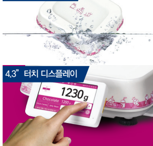
4.3" 터치 디스플레이