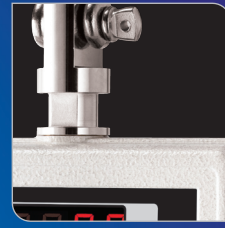
가볍고 견고한 구조