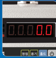
밝고 선명한 20mm LED 디스플레이