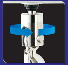
편리한 회전식 후크