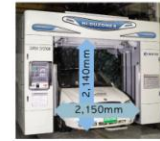
세차가능 차폭/차고 확대