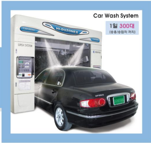
Car Wash System