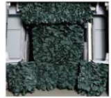
Miracle Cloth Brush

탐브러시 SUV차량의 앞유리 세척 시스템 SUV(지프타입) 차량 Return Wash System