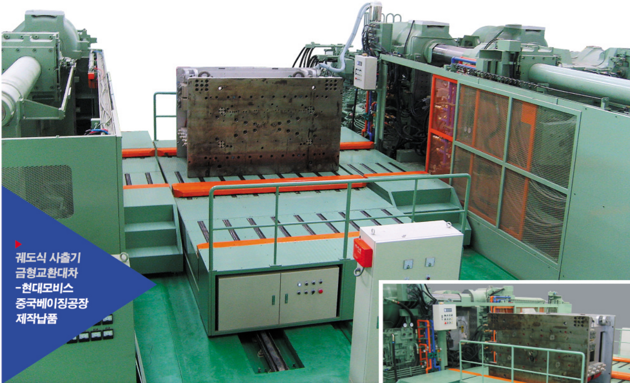
궤도식 사출기 금형교환대차 - 현대모비스 중국베이징공장 제작납품