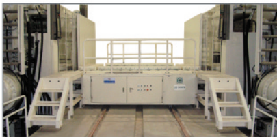
◀ 궤도식 사출기 금형교환대차 - 현대모비스 러시아공장 제작납품