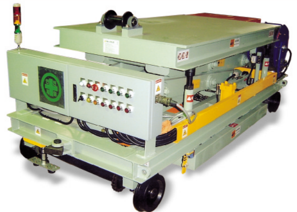
◀ POSCO 포스코 납품 Bung Handling Car 무궤도식