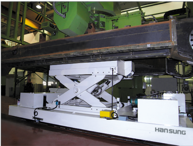
▶ 두산인프라코어 중장비 북라인에 공급