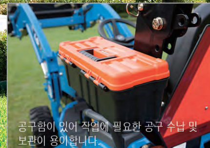
공구함이 있어 작업에 필요한 공구 수납 및 보관이 용이합니다.