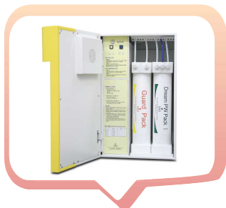
[ Pure 모델 ]