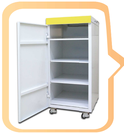
[ Cabinet Type ]