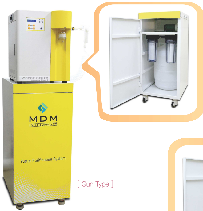
[ Gun Type ]