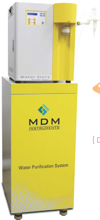
[ Dispenser Type ]