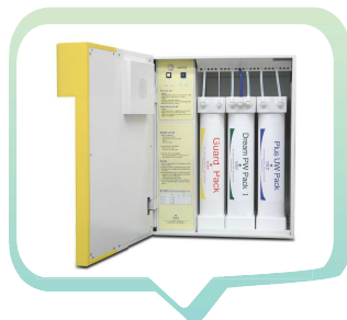
[ Plus 모델 ]