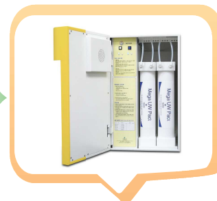
[ Mega 모델 ]