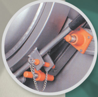
Locked state of outlet door