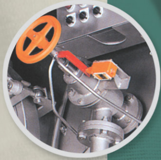
The opening and closing of the safety exhaust valve is detected, and the completion and progress of the process is controlled electrically